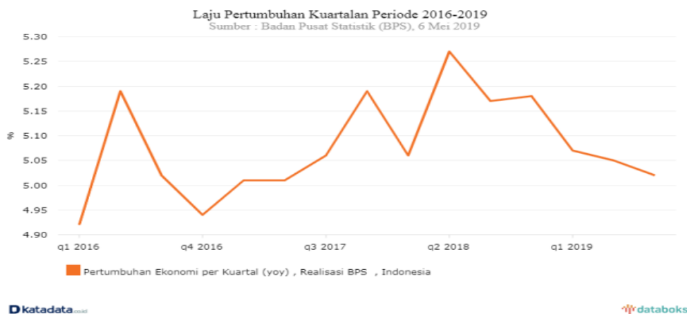
Gambar 2. Laju pertumbuhan ekonomi Indonesia periode 2016-2019

an bli-bli adalah 21395600 pengunjung, dengan jumlah pegawai 1559 karyawan. Jumlah pengunjung per bulan jd-id adalah 5524000 pengunjung, dengan jumlah pegawai 1048 karyawan. semakin tinggi jumlah pengunjung identik dengan jumlah karyawan yang bekerja sebagai biro jasa pelayanan masing-masing marketplace